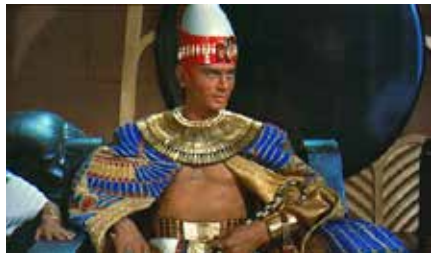
Fotogrammer af den klassiske version

”Exodus: Gods and Kings”, af Ridley Scott, er historien fra Biblens Anden Mosesbog. Den er en episk historie som fortæller om en frihedskamp, om hvordan Moses befrier israelitterne fra slaveriet og følger dem ud af Ægypten. En virkelig betydningsfuld historie, som instruktoren har lavet med flotte 3D effekter, god musik og et godt manuskript, og har udgivet en intens og underholdende film, på trods af de to og en halv time varighed. Man keder sig ikke i biografen, og oplevelsen er positiv overraskende og spændende.