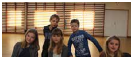
En del af 1.kommunions undervisningsgruppe

Firmelses sakramente er fuldendelsen af dåbens nåde. Ved firmelsen knyttes de døbte mere fuldkomment til hele Kirken og beriges med kraft fra Helligånden. Ved firmelsen modtager den døbte missionen til at udbrede troen i ord, og gerning som Kristi sande vidner.